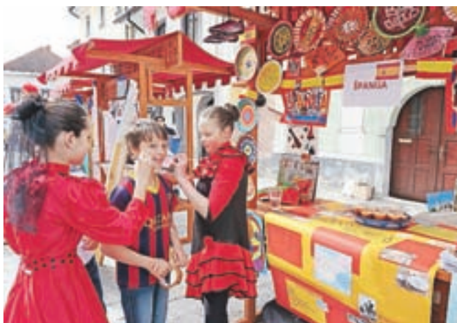
Evropsko vas so tudi letos na dan Evrope gostili v Radovljici. Učenci OŠ A. T. Linhartarja so takole predstavili slikovito Španijo.

ravili tudi prihodnje leto. Letos je v projektu sicer sodelovalo več kot dvesto šol iz Slovenije. Evropske vasi so postavili v osmih območjih središčih: v Radovljici, Murski Soboti, Mariboru, Slovenj Gradcu, Celju, Ljubljani, Novi Gorici in Kopru.