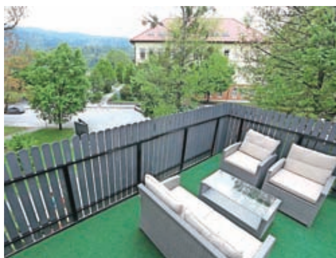
Malokdo še ve, da se z dveh teras nekdanjega hotela Grajski dvor, ki sta zdaj del mladinskega hotela Life Hostel, ponujajo čudoviti razgledi po mestu in okolici.

Kot pravi, zavod Turizem destinacijo pospešeno promovira na nacionalnem nivoju pa tudi širše. "Prejšnji teden smo tako imeli v Radovljici v okviru študijske ture, ki jo organizira Slovenska nacionalna turistična organizacija, na obisku 85 tujih agentov, ki smo jim destinacijo predstavili v povezavi z gostinci. To so običajno tisti agenti, ki so prvič v Sloveniji, kar pomeni, da vsako leto prihajajo novi in odpirajo številne nove priložnosti za razvoj prepoznavnosti destinacije. Na ta način, pa seveda s projekti, kakršen je Festival čokolade, opozarjamo nase. Ne čakamo, da nas bodo opazili in promovirali drugi."