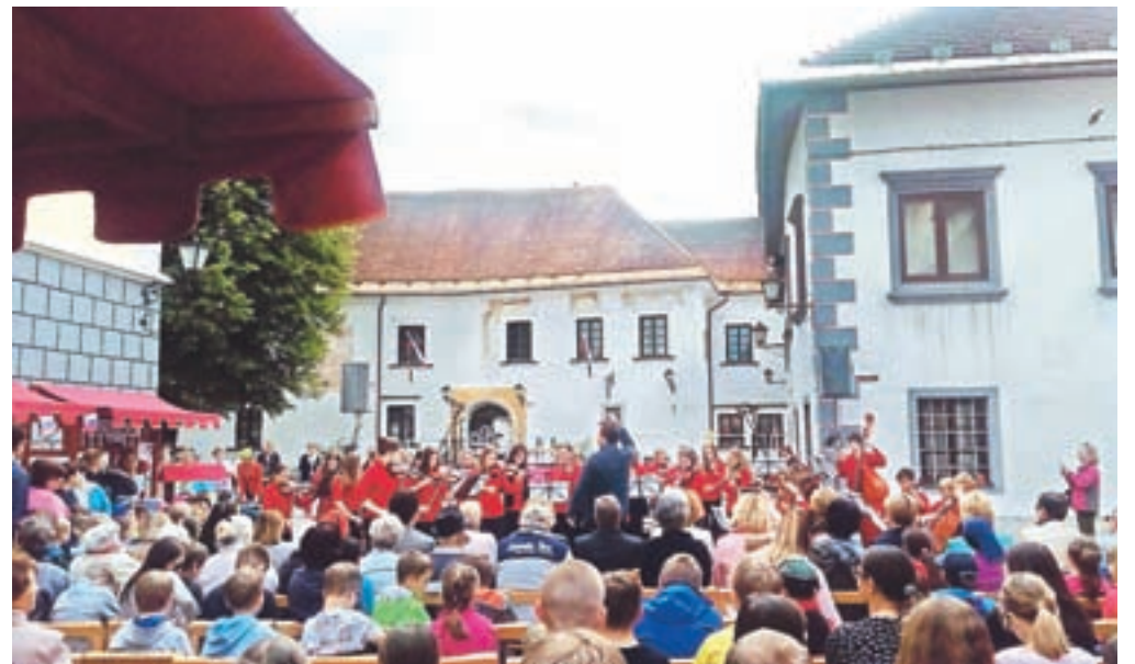
Udeleženci projekta so z zanimanjem spremljali tudi pester kulturni program.

Organizacijo prireditve je tudi letos, že tretje leto zapored, prevzela Osnovna šola Antona Tomaža Linhartarja Radovljica, omogočile pa so jo občine sodelujočih in zavod Turizem Radovljica. Projekt sta sicer dolga leta vodila Šola za ravnatelje in Evropska hiša Maribor, v