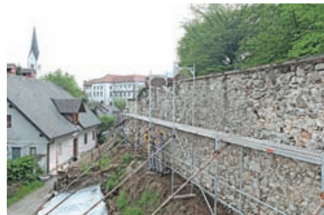
V Radovljici so konec prejšnjega tedna vendarle začeli obnavljati zadnji del grajskega obzidja.

Radovljica – V Radovljici so v teh dneh začeli z obnovo in rekonstrukcijo grajskega obzidja, za katerega je občina pridobila tudi soglasje zavoda za varstvo kulturne dediščine. Okoli sto tisoč evrov vredna sanacija srednjeveškega obzidja bo trajala predvidoma do konca maja, nujna pa je predvsem zaradi padanja kamenja. Občina Radovljica je ta del zidu, ki je bil v preteklosti v zasebni lasti, pred tremi leti kupila na javni dražbi prav za namenom obnove in celovitega urejanja grajskega parka, ki se razprostira med hotelom Grajski dvor in starim mestnim jedrom. Že pred tem so obnovili večji del zidu, zadnji, katerega obnovo začinjajo sedaj, pa je doslej propadal. Na nevarnost, ki jo predstavlja razpadajoče zidovje, je pred leti opozarjala vnukinja v Radovljici rojenega arhitekta Ivana Vurnika Marija Žumer Pregelj. Kamenje je namreč, dokler občina ni uredila zaščitne ograje, ogrožalo pod obzidjem stoječo hišo, v kateri je do svoje smrti živel slavni arhitekt.