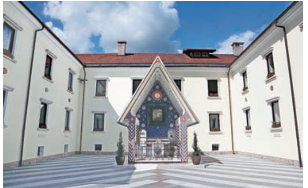
Vurnikova kapela svetega Frančiška na Brezjah

šim učencem Glasbene šole Radovljica. V sredo, 7. junija, pa bo ob 20. uri v atriju Radovljiške graščine še večer poezije Neže Maurer. Dogodek z naslovom Takrat, kadar ljubimo pripravlja KUD Radovljica, Linhartov oder.