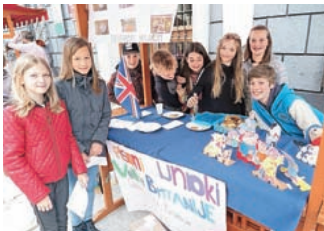
Učenci OŠ Žirovnica so se odločili, da predstavijo Veliko Britanijo, in sicer z zanimivimi in slikovitimi junaki risanih filmov.