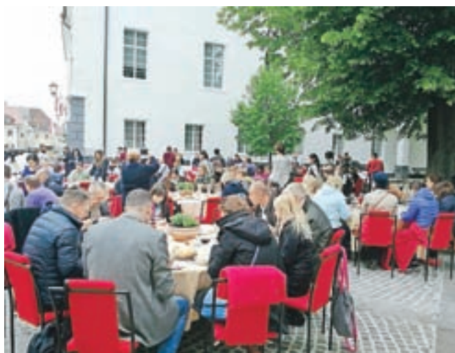
Da je za obisk Radovljice vse več zanimanja, kaže tudi obisk kar 85 tujih agentov, ki so jim ponudili kosilo na trgu pred cerkvijo.