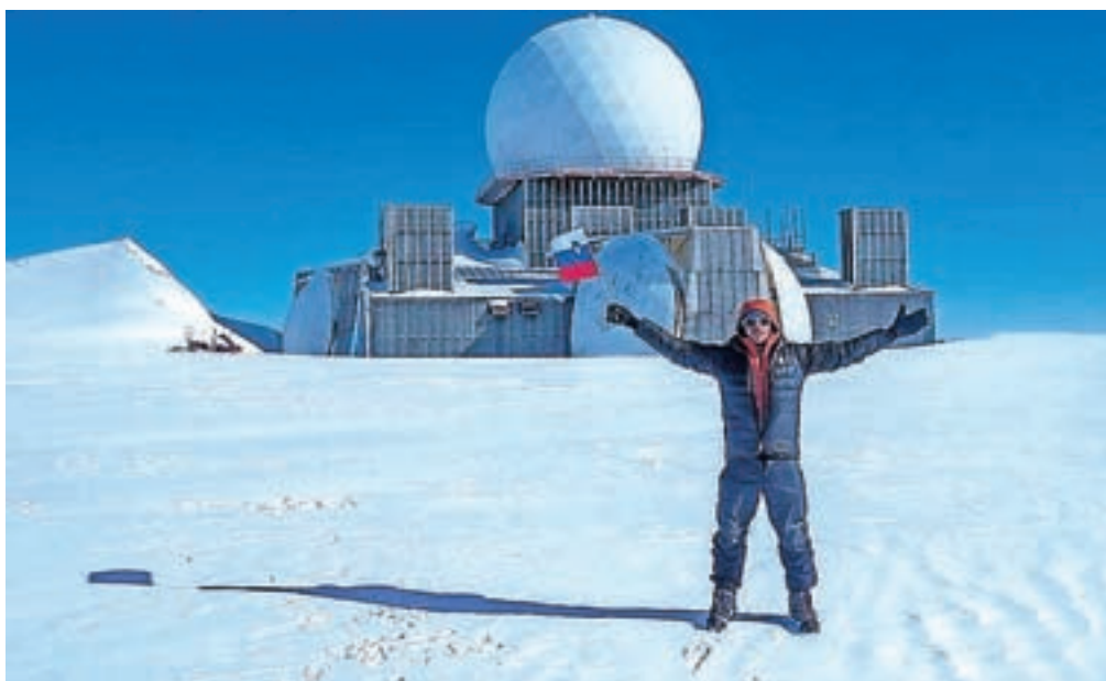
Po sedmih dneh odprave sta prišla do prve točke na horizontu: DYE – ameriške radarske postaje, ki so jo zapustili pred tridesetimi leti. Na vrhu je radar.

Dolžina odprave je bila 582 kilometrov, za kar sta potrebovala 18 dni, od tega sta dva dni zaradi neugodnih vremenskih razmer morala čakati. To pomeni, da sta bila dejansko na poti 16 dni, 10 ur in 52 minut. Na dan sta na smučeh naredila v povprečju 36 kilometrov, največ 80 kilometrov, najmanj pa 11. Najvišja točka, ki sta jo dosegla, je 2485 metrov, najnižja pa nič. Na poti sta imela izredno težke vremenske pogoje s hudim mrazom in vetrom, kakršnih nista pričakovala. Temperature so se spustile celo do 34 stopinj pod ničlo,