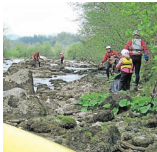
Nabrali so kar petnajst velikih vreč odpadkov.

Fun rafting kajak kanu klub iz Radovljice je v soboto, 22. aprila, izvedel akcijo čiščenja reke Save od Radovljice do Globokega. Akcije se je udeležilo več kot 50 udeležencev, med njimi tudi deset udeležencev iz Hrvaške. Kot so sporočili po akciji, so nabrali kar 15 velikih vreč odpadkov, med katerimi je bilo največ manjših kosov polivinila. Zaključek akcije je bil v Globokem, kjer je gostitelj poskrbel za brezplačno hrano in pijačo.