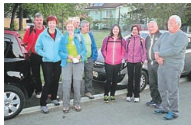
Pohodniki iz Radovljice, Begunj in Mošenj so se s prijatelji iz Zavrha in Ljubljane tudi letos odpravili na Pohod ob žici.

osemnajstič. »Začeli smo zelo zgodaj zjutraj, saj smo se odpravili na najdaljšo, 35-kilometrsko pot, ki smo jo, s postanki vred, opravili v osmih urah. Tudi letos je bilo čudovito: prekrasno vreme, pohodnikov več kot kadarkoli doslej. Vzdušje je bilo res enkratno! In ker je naše geslo: lušno je bilo, naslednje leto ponovimo, se bomo pohoda prav gotovo udeležili tudi prihodnje leto.«