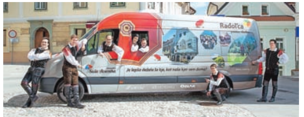
Oblikovanje zunanje podobe vozila predstavlja vez med Avseniki, glasbo in njihovim domom.

Ansambel Saša Avsenika ter Radol'ca s skupnimi promocijskimi aktivnostmi vstopajo v Evropo.