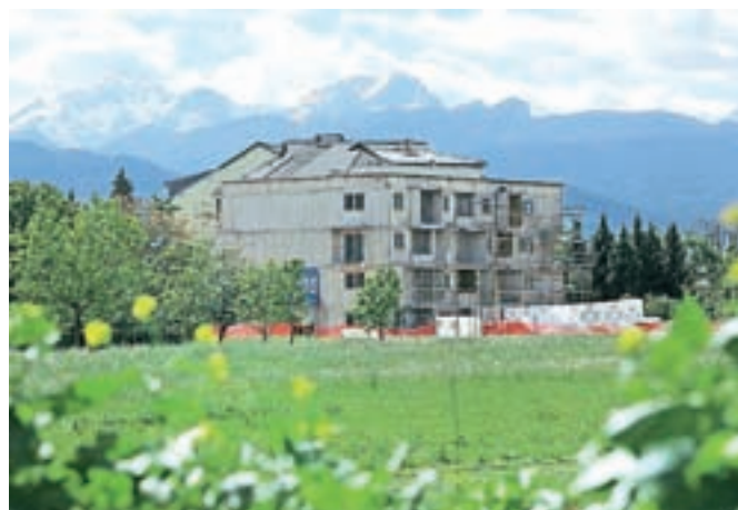
Od začetka letošnjega leta se gradnja oskrbovanih stanovanj v Radovljici spet intenzivno nadaljuje.

zasebniku, radovljiškemu podjetju Remand, s katerim je občina podpisala predpogodbo, ki vsebuje zavezo investitorja, da bo večina oskrbovanih stanovanj najemna in ne namenjena prodaji ter da bodo prednost pri najemu imeli domačini. A se tudi to ni izšlo, vsa radovljiška stanovanja so namreč namenjena prodaji, o možnosti najema investitor za zdaj ne razmišlja. Na občini pojasnjujejo, kakšno je trenutno stanje. »Ker podjetje Remand ni zaključilo gradnje oskrbovanih stanovanj in je v stečaju, pogodba, ki jo je občina sklenila z Remandom v letu 2010, ni bila realizirana in ne bo izvršena. Občina sicer v projekt izgradnje oskrbovanih stanovanj ni vlagala, ostaja pa obveznost plačila v letu 2010 odmerjenega komunalnega prispevka. To obveznost bomo uveljavljali pri novem investitorju, to je podjetju Rezidenca Senior d.o.o.,« so sporočili iz kabineta župana Globočnika.