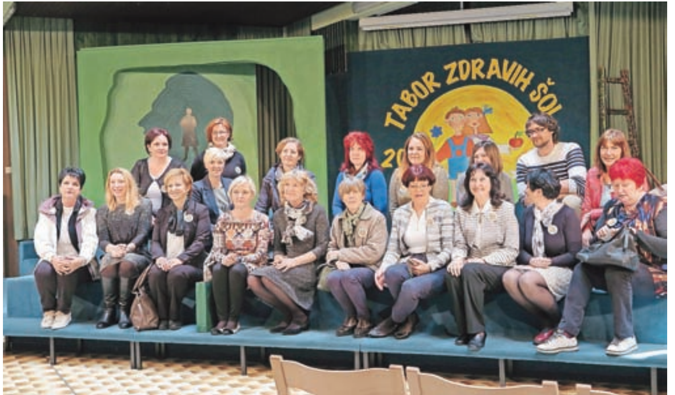
Srečanja v Radovljici so se udeležili predstavniki desetih slovenskih osnovnih šol, ki so pred več kot dvajsetimi leti prve stopile v projekt Zdrava šola.

Na srečanju učiteljev spremljevalcev se je glede na izkušnje, ki so jih izpostavili, pokazalo, da cilji Zdrave šole in različni podpro-