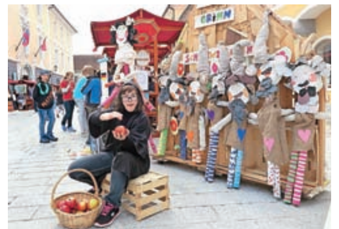
Učenci sodelujočih šol so z njihovimi značilnostmi, barvami in kulinariko predstavili prav vse države Evropske unije.